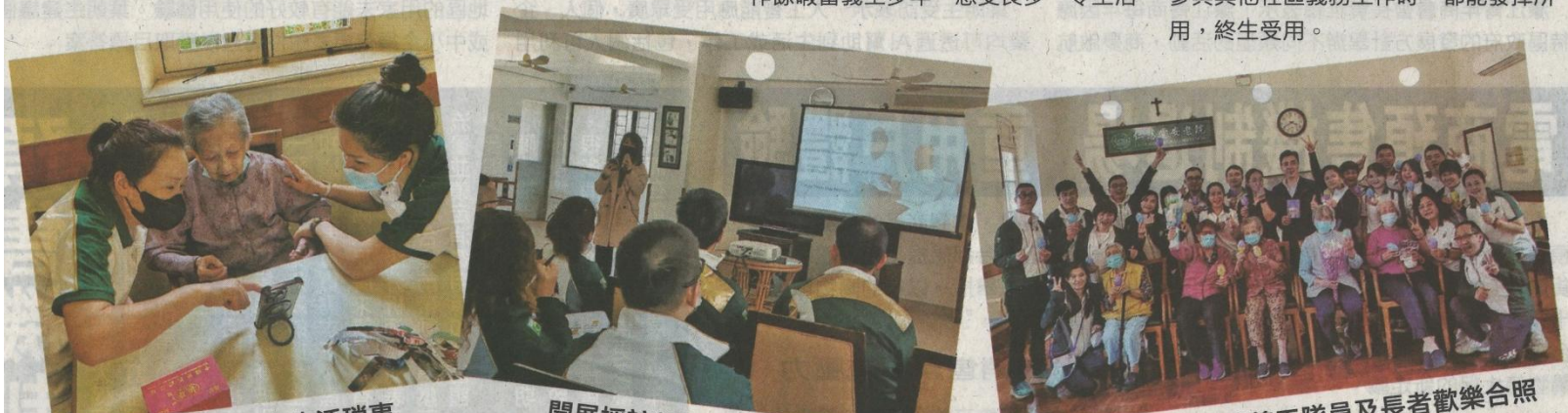
義工隊員及長者歡樂合照