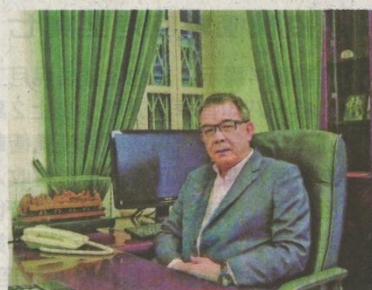
飛安達支持長者友誼計劃